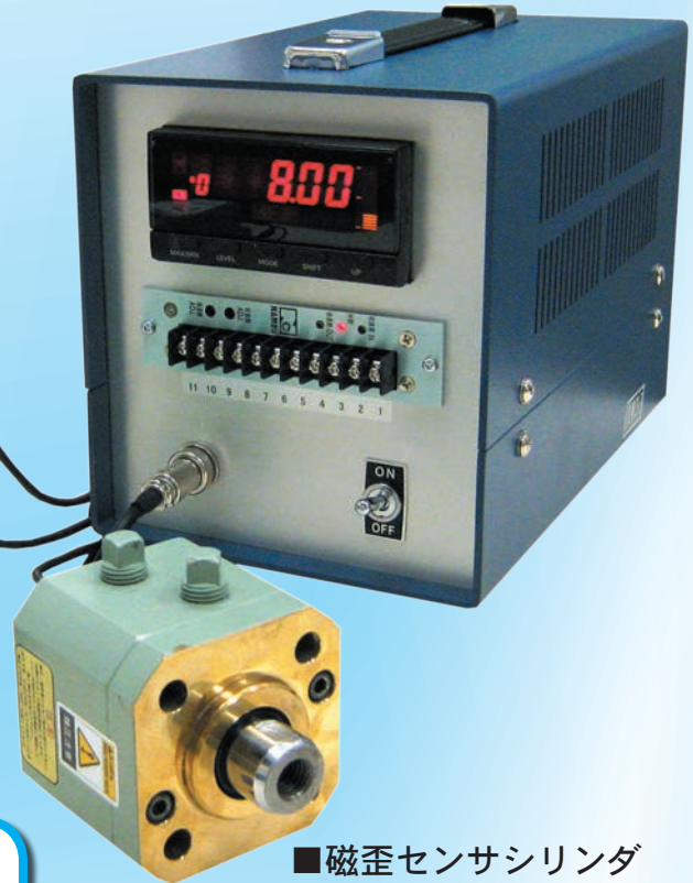
■磁歪センサシリンダ